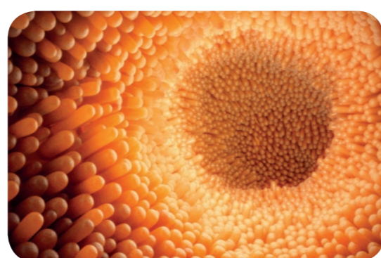
Microscopic image of intestinal villi